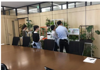
2023 緑の取組み部門受賞作品 SLOW GREEN UNITY

受賞した作品の審査資料の使用権は屋内緑化推進協議会に帰属するものとし、会の出版物等に使用する権利を得たものとします。