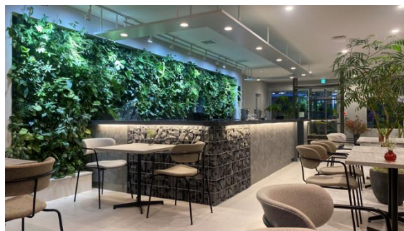
2023 受賞作品 爽緑アートウォール