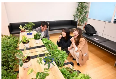
2023 緑の取組み部門受賞作品 建築設計者によるバイオフィ リア体験型ラボ