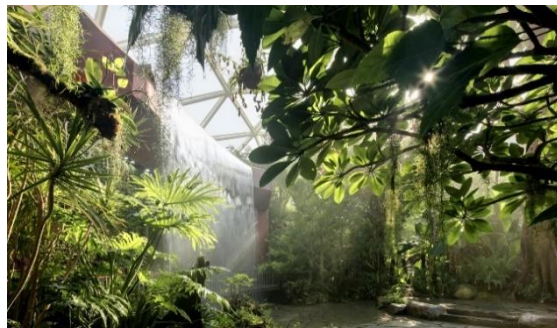
2023 受賞作品 Botanical Pavilion