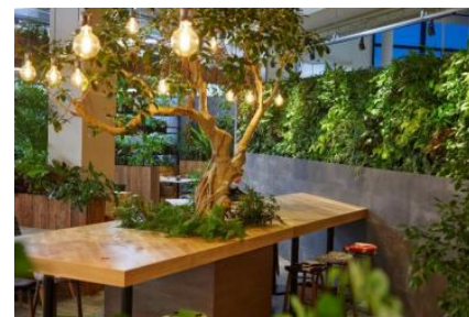
2023 受賞作品 ホームセンターで 自然を感じられる美味しい空間