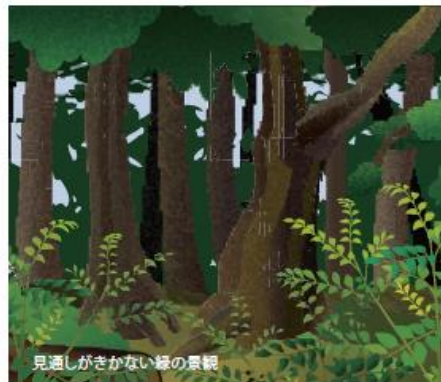
見通しがきかない緑の景観