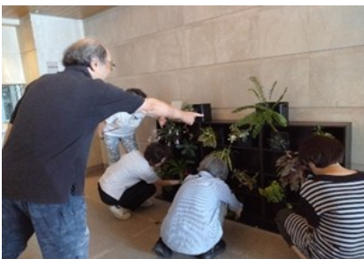
2025 受賞作品 庭のないマンションで仲間と一緒に園芸を！

受賞した作品の審査資料の使用権は一般社団法人屋内緑化推進協議会等に使用する権利を得たものとします。