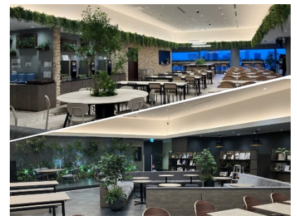
2025 受賞作品 みどりによるアップデート空間