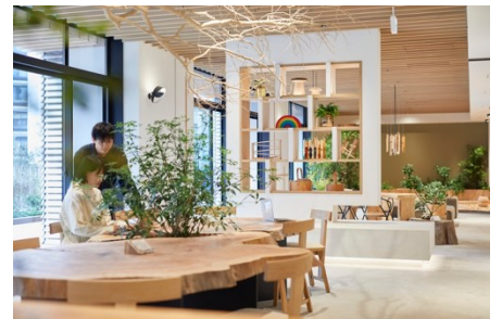
2025 受賞作品 13種の5「木」と「樹」と暮らすワークラウンジ