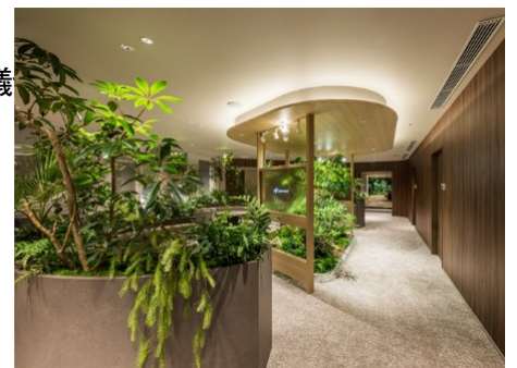
2025 受賞作品 阪急阪神不動産 ジオゲストサロン 新宿