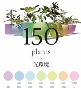
2025 受賞作品 おうち植物園 PJ