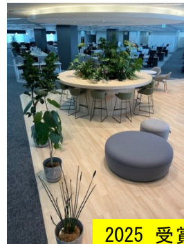
2025 受賞作品 ウエルカム & ブレークスルーガーデン